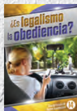
Guía de Estudio 14: ¿Es legalismo la obediencia?

Cuando hayas terminado las primeras 14 Guías de Estudio, pregunta por nuestra colección de estudios avanzados, escribiendo a: Amazing Facts • P.O. Box 909 • Roseville, CA 95678-0909