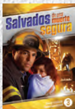
Guía de Estudio 3: Salvados de una muerte segura