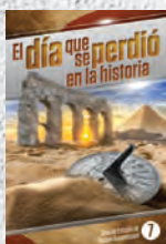
Guía de Estudio 7: El día que se perdió en la historia