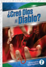
Guía de Estudio 2: ¿Creó Dios al diablo?