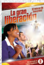
Guía de Estudio 8: La gran liberación