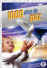
Guía de Estudio 12: 1000 años de paz