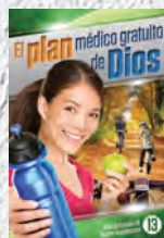
Guía de Estudio 13: El plan médico gratuito de Dios