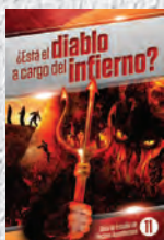
Guía de Estudio 11: ¿Está el diablo a cargo del infierno?