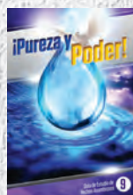
Guía de Estudio 9: ¡Pureza y poder!