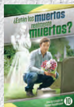
Guía de Estudio 10: ¿Están los muertos realmente muertos?