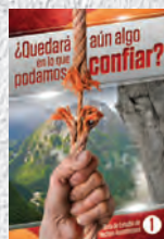
Guía de Estudio 1: ¿Quedará aún algo en lo que podamos confiar?

Cada lección está repleta de hechos asombrosos que te transformarán a ti y a tu familia, y les darán esperanza duradera. ¡No te pierdas ni una sola!