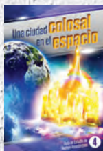
Guía de Estudio 4: Una ciudad colosal en el espacio