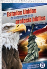
Guía de Estudio 21: Los Estados Unidos de Norteamérica en la profecía bíblica