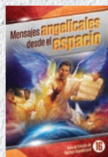
Guía de Estudio 16: Mensajes angelicales desde el espacio