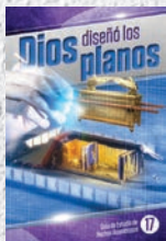
Guía de Estudio 17: Dios diseñó los planos