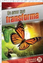
Guía de Estudio 26: Un amor que transforma