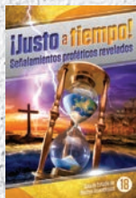
Guía de Estudio 18: ¡Justo a tiempo! Señalamientos proféticos revelados