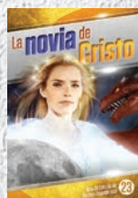
Guía de Estudio 23: La novia de Cristo