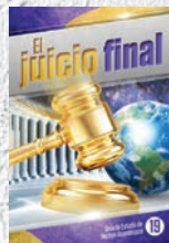
Guía de Estudio 19: El juicio final