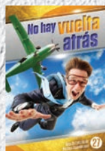
Guía de Estudio 27: No hay vuelta atrás

¿Viste las primeras 14 Guías de Estudio? Si no, asegúrate de escribir a: Amazing Facts • P.O. Box 909 • Roseville, CA 95678-0909