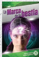
Guía de Estudio 20: La marca de la bestia