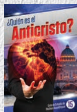
Guía de Estudio 15: ¿Quién es el Anticristo?

Cada Guía de Estudio está repleta de hechos asombrosos que te impactarán a ti y a tu familia. ¡No te pierdas ni una sola!