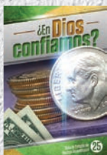
Guía de Estudio 25: ¿En Dios confiamos?