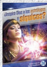
Guía de Estudio 24: ¿Inspira Dios a los astrólogos y siquicos?