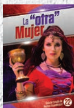
Guía de Estudio 22: La "otra" mujer