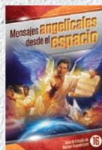
Guía de Estudio 16: Mensajes angelicales desde el espacio