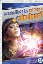
Guía de Estudio 24: ¿Inspira Dios a los astrólogos y síquicos?