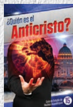
Guía de Estudio 15: ¿Quién es el Anticristo?

Cada Guía de Estudio está repleta de hechos asombrosos que te impactarán a ti y a tu familia. ¡No te pierdas ni una sola!