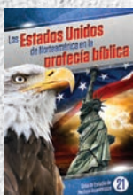
Guía de Estudio 21: Los Estados Unidos de Norteamérica en la profecía bíblica