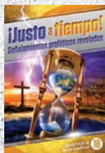
Guía de Estudio 18: ¡Justo a tiempo! Señalamientos proféticos revelados