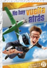
Guía de Estudio 27: No hay vuelta atrás

¿Viste las primeras 14 Guías de Estudio? Si no, asegúrate de escribir a: Amazing Facts • P.O. Box 909 • Roseville, CA 95678-0909