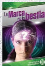
Guía de Estudio 20: La marca de la bestia