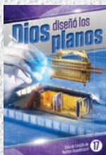
Guía de Estudio 17: Dios diseñó los planos