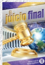
Guía de Estudio 19: El juicio final