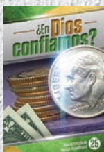
Guía de Estudio 25: ¿En Dios confiamos?