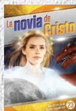
Guía de Estudio 23: La novia de Cristo